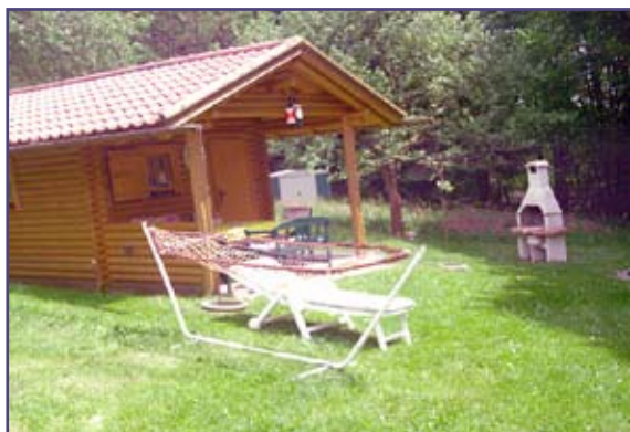
Grillplatz mit Hütte und Liegewiese

Die Lage unseres Hauses ist ideal für Sommer- und Winterurlaub: